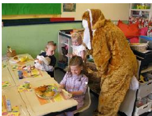
Paasontbijt op school, iedereen komt in pyjama