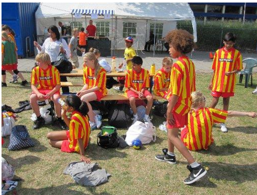
Tijdens het korfbaltoernooi

In de onderbouw staat bewegingsonderwijs dagelijks op het programma. De kinderen spelen dan op het schoolplein of in de speelzaal. De leerkrachten bieden individuele, groeps- en kringspelletjes aan die ook de sociaal-emotionele ontwikkeling bevorderen. Vanaf groep 3 krijgen de kinderen gymles in de sporthal, eenmaal van de vakleerkracht en eenmaal van de eigen leerkracht. De kinderen in groep 4 krijgen zwemles in “De Veur”. Deze zwemlessen vinden plaats onder verantwoordelijkheid van Passe Partout. Tijdens de zwemles wordt de pedagogisch/ onderwijskundige taak echter in handen gegeven van het zwembadpersoneel. Het zwembadpersoneel heeft- in tegenstelling tot de gymnastiekonderwijzeres- geen onderwijskundige bevoegdheid. De klassenleerkracht blijft daarom bij de zwemles aanwezig om extra toezicht te houden en zo nodig in te grijpen. Met de gemeente vindt op regelmatige basis overleg plaats om de veiligheid tijdens de zwemlessen zo optimaal mogelijk te laten zijn. Badpersoneel en klassenleerkracht dienen zich te houden aan het protocol dat is afgesproken tussen alle voornoemde partijen. Dit protocol heeft betrekking op de wijze waarin de kinderen van –en naar het bad begeleid worden, het toezicht dat daarbij plaatsvindt en de verdeling van verantwoordelijkheden.