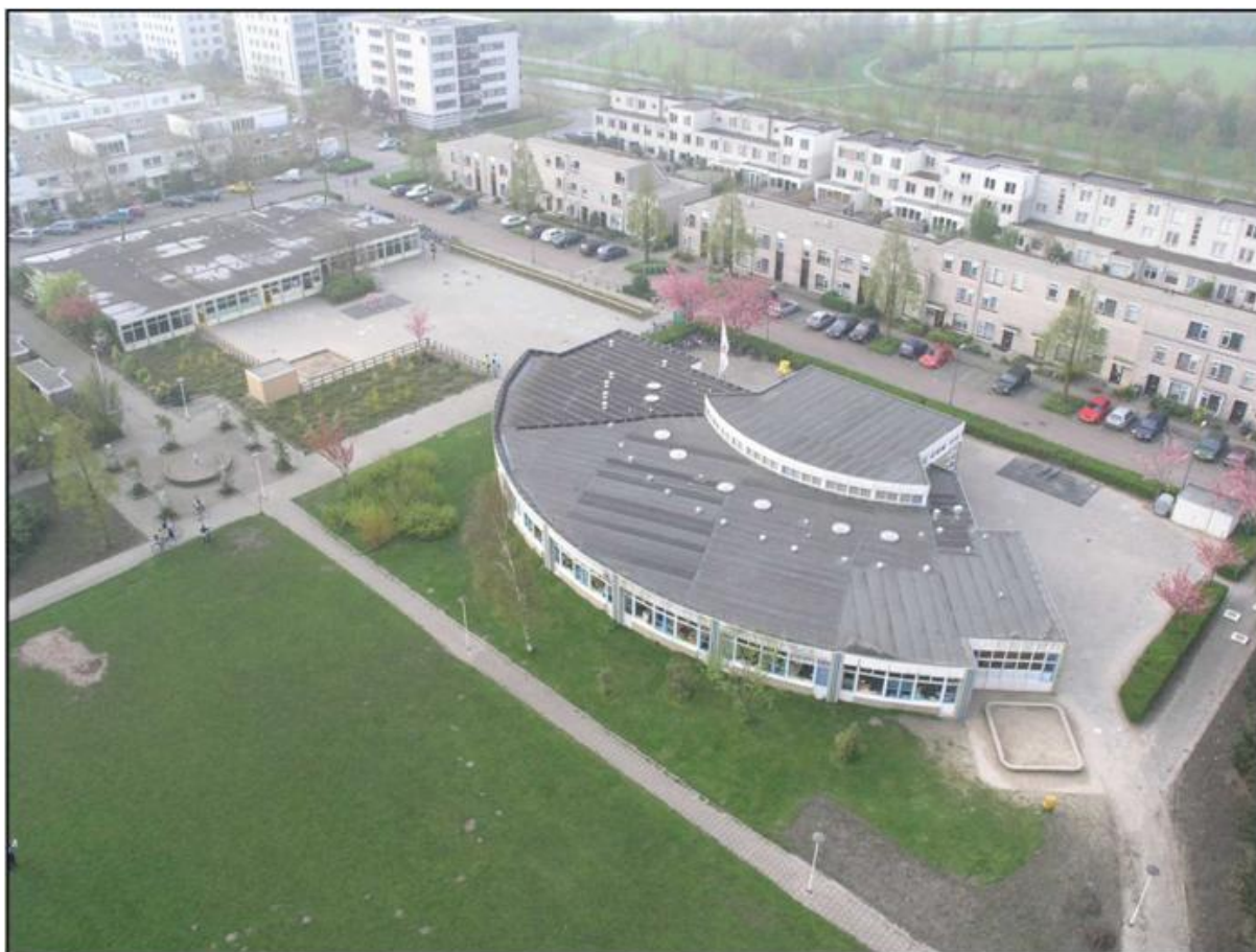
Passe Partout, situatie voorjaar 2005. Inmiddels is er een verdieping toegevoegd!

jezelf ten doel had gesteld, dat zien lukken en daar waardering voor ontvangen helpt je enorm een volgende keer weer ergens aan te beginnen. Je zelfvertrouwen, letterlijk “het vertrouwen in eigen kunnen”, neemt er door toe. Leerlingen die het niet opbrengen zichzelf passende doelen te stellen worden daarmee geholpen. Het ‘leren studeren’ komt zodoende spelenderwijs aan de orde, en is een handig opstapje voor het werken binnen het voortgezet onderwijs! Als zevende en achtste groeper gaan kinderen in deze bouw op werkweek in één van de Nederlandse buitenaccommodaties! Het zijn weken vol actie, sport en spel en culturele activiteiten. Van de ouders wordt een bijdrage van rond de € 180,- gevraagd, desgewenst middels een spaarsysteem.