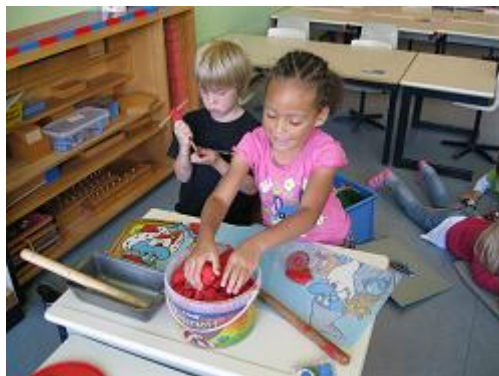
of gewoon lekker kleien