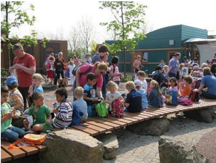
Schoolreisje in het Dolfinarium

Ieder jaar organiseren we voor alle groepen een schoolreisje van een dag. (kinderen in groep één, die na de eerste januari van het lopende jaar vier werden gaan niet mee op schoolreis. De ervaring leert dat dit een te vermoeiende activiteit is voor de allerjongsten).