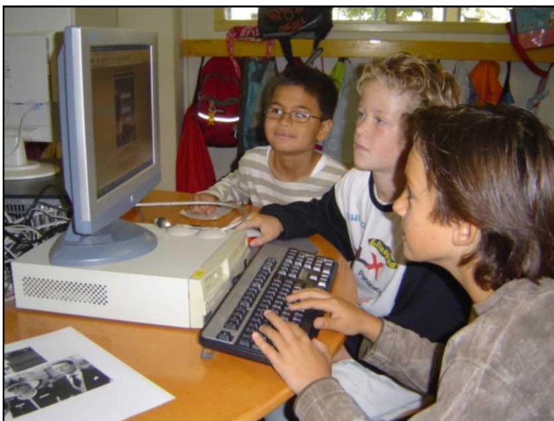
De computer wordt zo vanzelfsprekend mogelijk ingezet in alle bouwen, en dankzij de inzet van de systeembeheerder functioneert ons netwerk

We werken op school met computers. We maken gebruik van programma's die de methode ondersteunen. Ook maken we gebruik van het Kurzweilprogramma voor