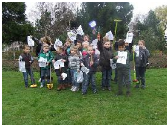
1 april grap